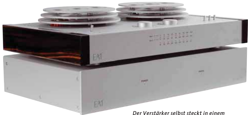
Der Verstärker selbst steckt in einem sehr hübschen Gehäuse, das Netzteil in einer eher unscheinbaren Kiste

Anschlüsse? Durchgehend unsymmetrisch, Die Verstärkungsumschaltung erfolgt mit einer Vielzahl kleiner Schalter