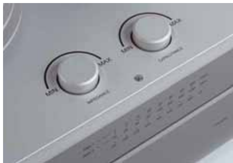
Impedanzen und Kapazitäten werden komfortabel per Drehrad eingestellt

niedrigerer Abschlussimpedanz ein bisschen Einhalt zu gebieten. Das kostet aber auch von dem wunderbaren „Saft“, den die Kombi ansonsten zu liefern imstande ist. Ungebremst mit diesem Gespann Musik zu hören ist eine schweißtreibende Angelegenheit und kann nur in dynamischer Hinsicht hartgesottenen Naturen empfohlen werden. Für jeden anderen nicht ganz