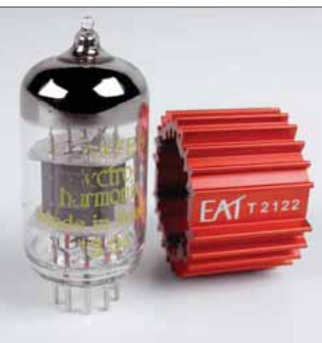
Die Dämpfer für die Röhren gehörten zu den ersten Produkten von EAT, hier saßen sie auf jedem der Glaskolben

Erste Reaktion eines Besuchers auf die EAT-Phonovorstufe: „Das ist aber hübsch. Ist das eine Tonbandmaschine?“